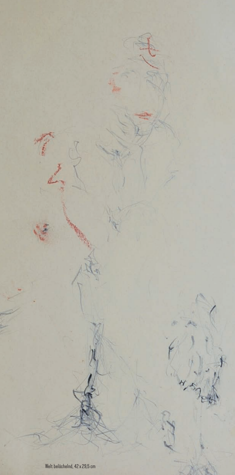
Welt belächelnd, 42 x 29,5 cm