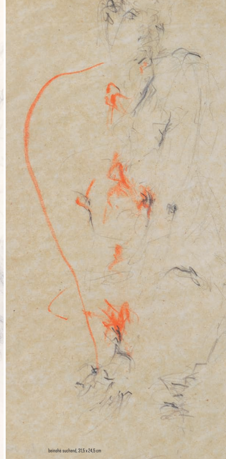
beinahé suchend, 31,5 x 24,5 cm