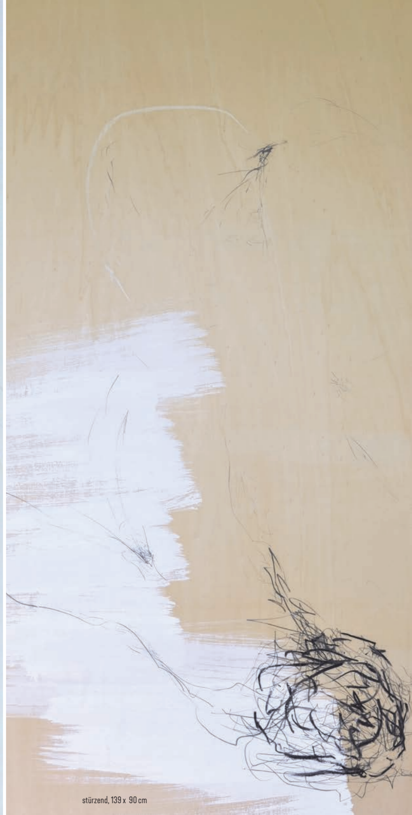
stürzend, 139 x 90 cm