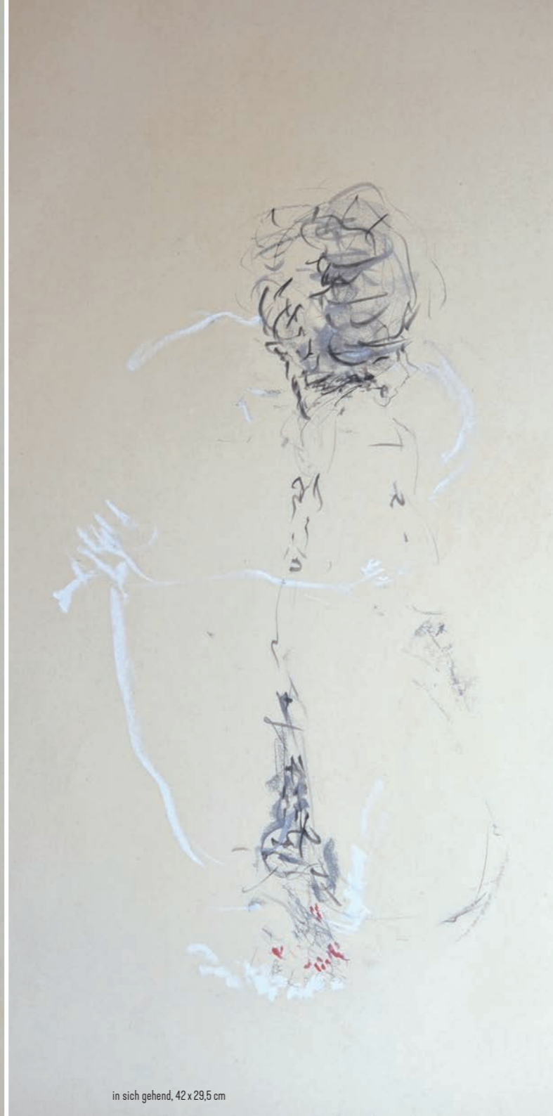
in sich gehend, 42 x 29,5 cm