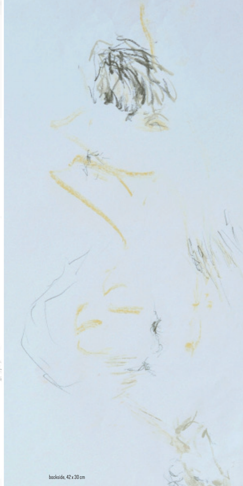
backside, 42 x 30 cm