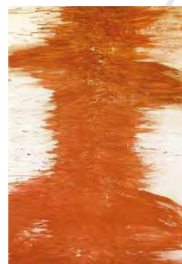
Stadtwerke Augsburg: ausgebreitet übermalt , 113 x 160