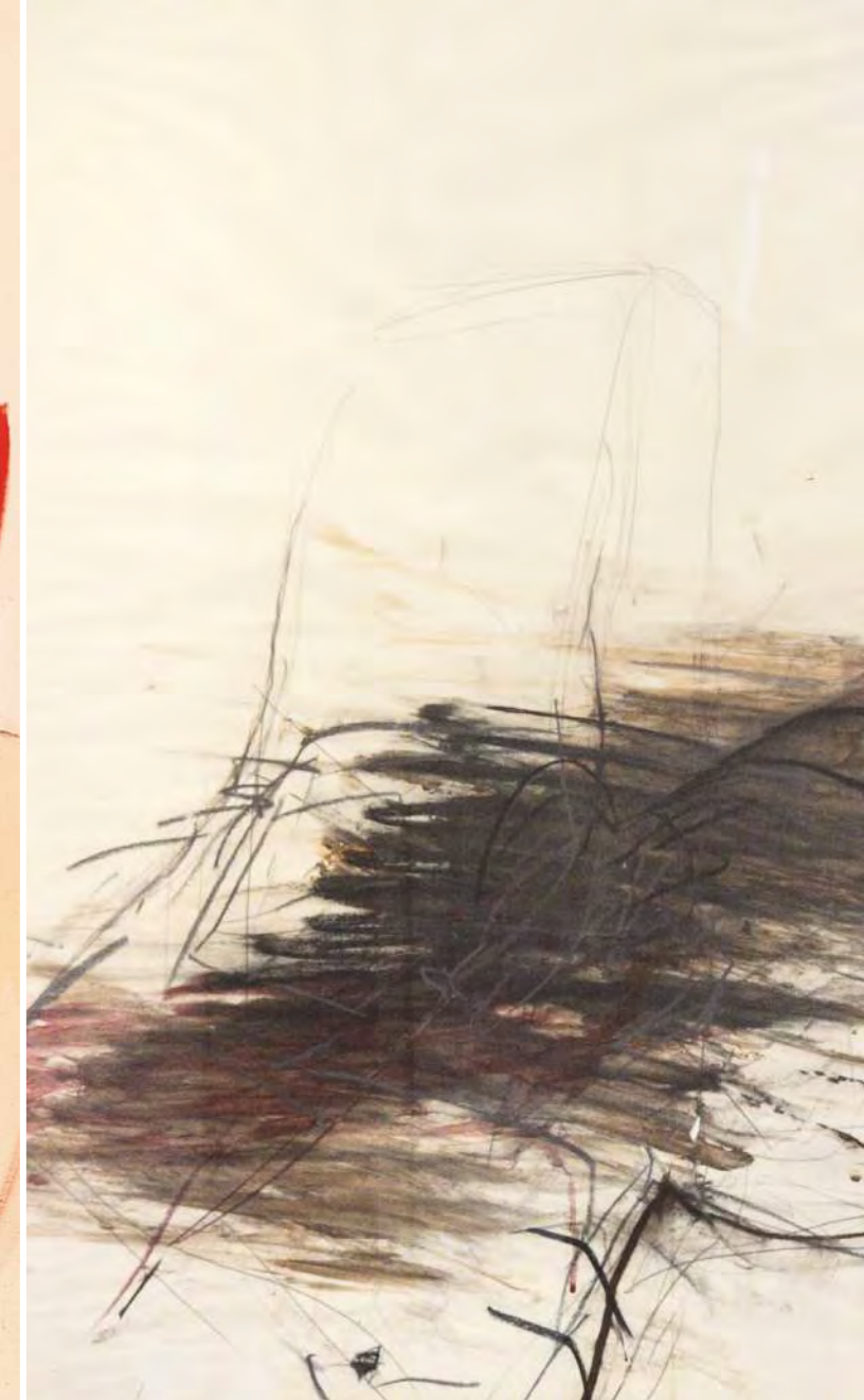
AKTive Chiffren übermalt, 70 x 100 (Ausschnitt)