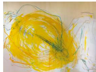
Stadt Memmingen: selfmade übermalt , 131 x 100