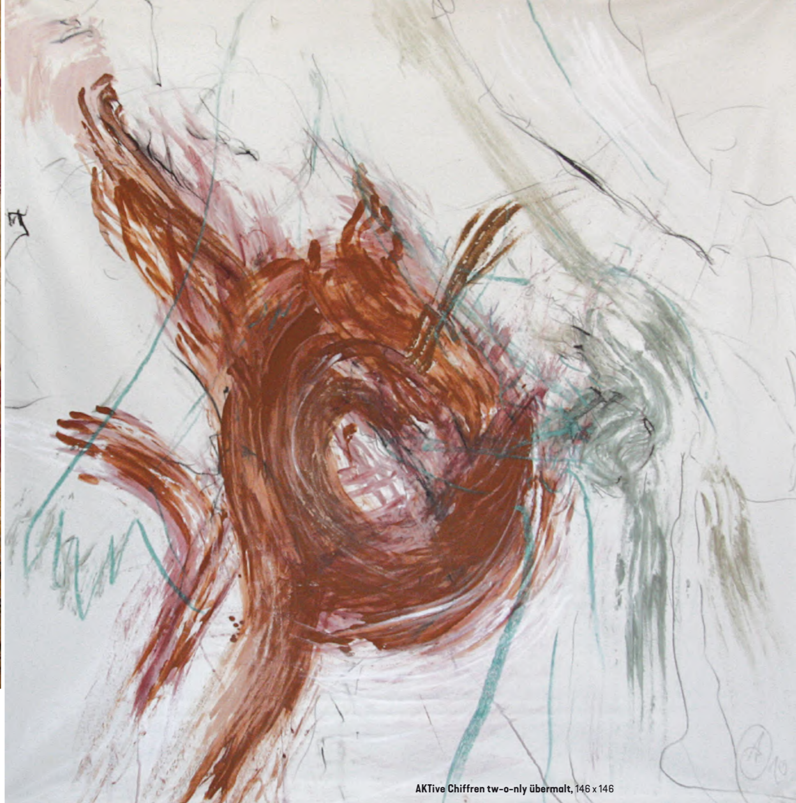
AKTive Chiffren tw-o-nly übermalt, 146 x 146