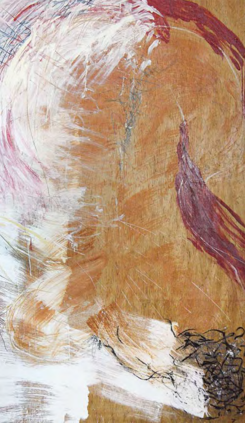
stürzend übermalt, 100 x 157 (Ausschnitt)