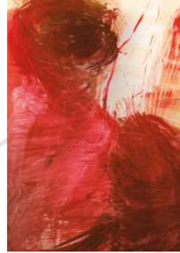
Sammlung Kaltner/Bayer: target übermalt , 90 x 139