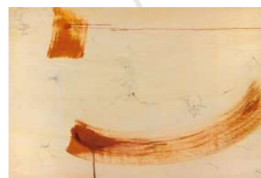
Sammlung Niemann: AKTive Chiffren ausbreitend , 139 x 90