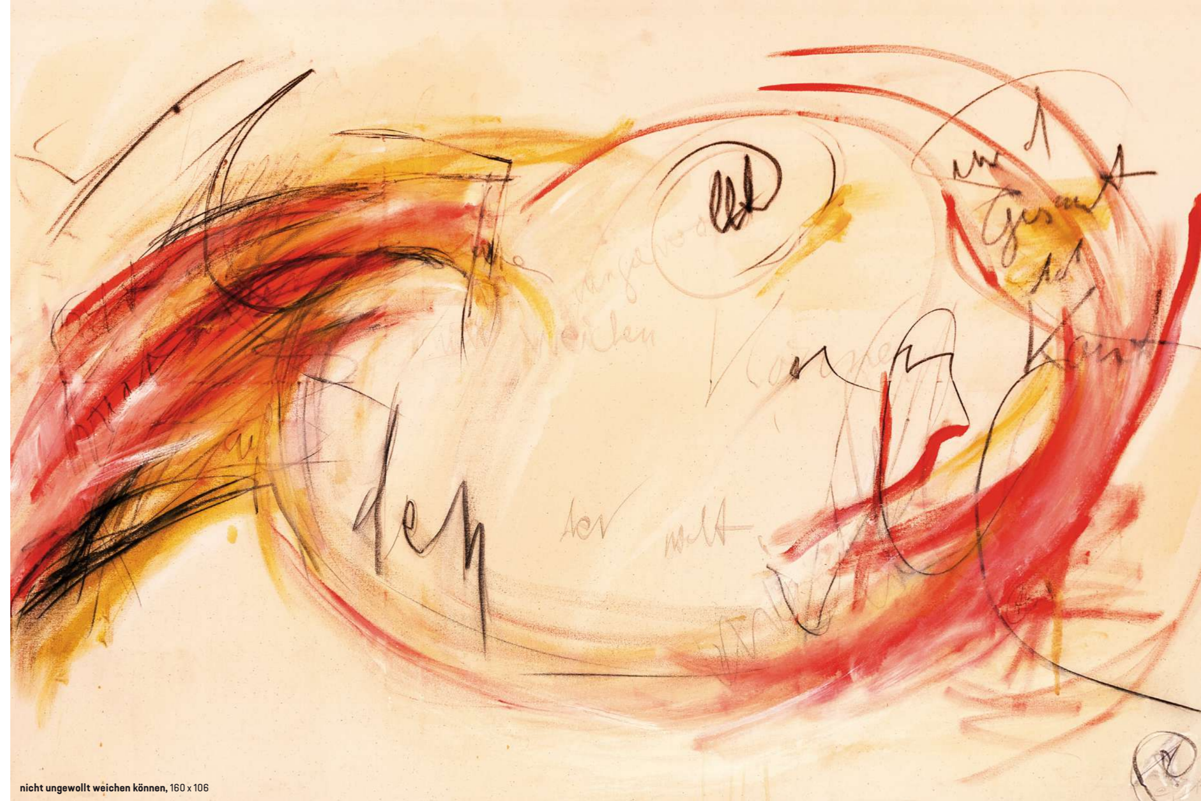
nicht ungewollt weichen können, 160 x 106